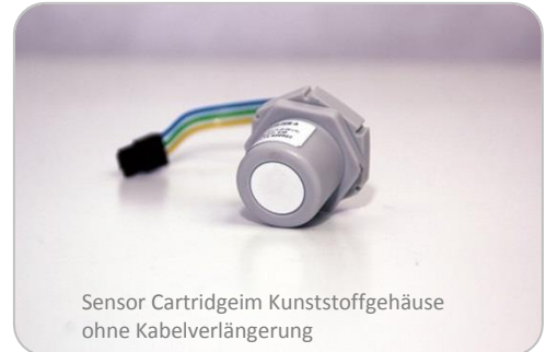
Sensor Cartridge im Kunststoffgehäuse ohne Kabelverlängerung