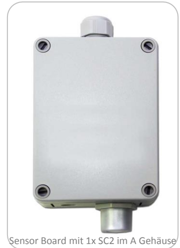
Sensor Board mit 1x SC2 im A Gehäuse